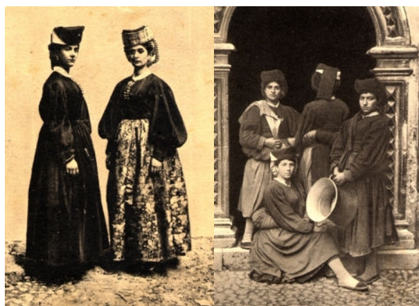
foggia festiva (seconda donna da sinistra) e foggia quotidiana dell'abito di scanno

La considerazione che possiamo trarne è che l'abito ottocentesco scannese rappresenta un oggetto culturalmente interessante e valido estetico e che certamente costituisce un fenomeno socio-culturale importante. E' tuttavia anche un fenomeno unico, isolato storicamente e frutto di un processo non comune al resto dei costumi abruzzesi, almeno fino all'avvento della honne de lu cutele , la prima foggia in bilico tra tradizione e moda "globale", apparso alla fine dell'ottocento in quasi tutto l'Abruzzo.