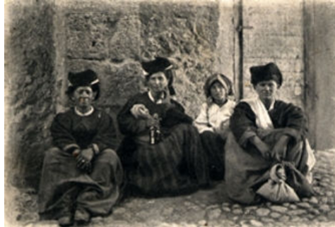
contadine di Scanno sedute secondo l'uso a gambe incrociate sulle pieghe della gonna

La storia del costume femminile di Scanno costituisce un unicum nel panorama abruzzese, in quanto in un breve lasso di tempo (circa un secolo) si sono avvicendate tre fogge molto diverse tra loro. La prima foggia (abito in rosso, turchese, giallo-bruno, a maniche staccate, busto steccato, molto ornamentato) è rimasta in auge fino a circa metà Ottocento, ed è di lunga tradizione e ben radicata in Abruzzo; la seconda (abito scuro, di panno pesante, sobrio e di taglio sartoriale con maniche attaccate e blusa non steccata), completamente diversa, si è affermata a metà Ottocento parallelamente alla nuova morale borghese e alla diffusione di modelli provenienti dall'esterno; la terza, di tipo più semplice e anonimo (composta da una gonna poco ricca e blusa scura, con cappello-fazzoletto anch'esso scuro) ancora oggi indossato dalle anziane, ha preso piede a partire dai primi anni del Novecento. In tutti e tre i casi si tratta di abiti autentici, documentati e conservati in esemplari giunti sino ai nostri giorni. Quindi lo spazio per eventuali illazioni è assai esiguo, in quanto è stato già compiuto in proposito un serio lavoro di ricerca.